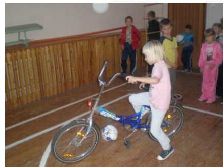
Конкурс «Безопасное колесо»