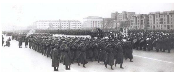
Военный парад в Куйбышеве 1941 года